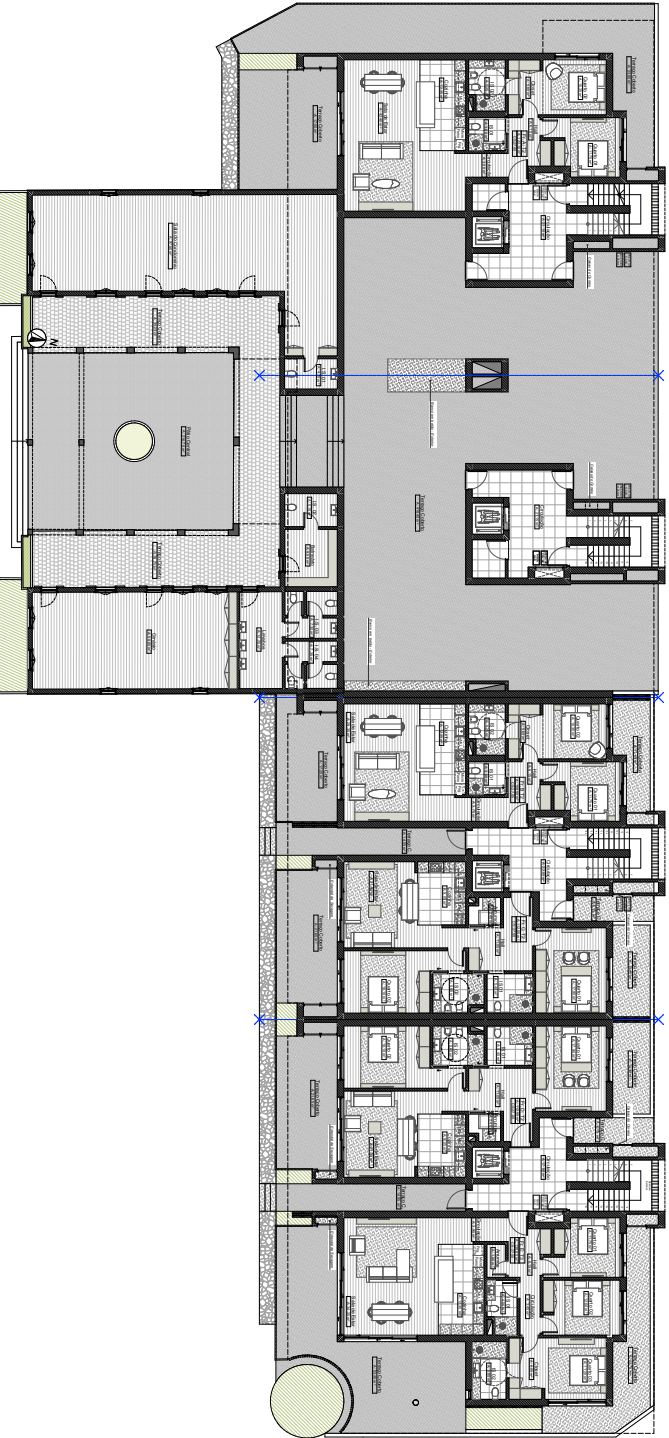
PLANTADO RES-DUO-CHAO - B01